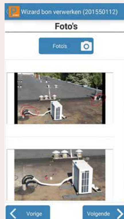
De webplatforms stellen klanten in staat om hun projecten of installaties te overzien – vergelijkbaar met een online logboek.

Michel Smedts, salesmanager bij Plenion: "Joris wilde meer kunnen doen met evenveel mensen.