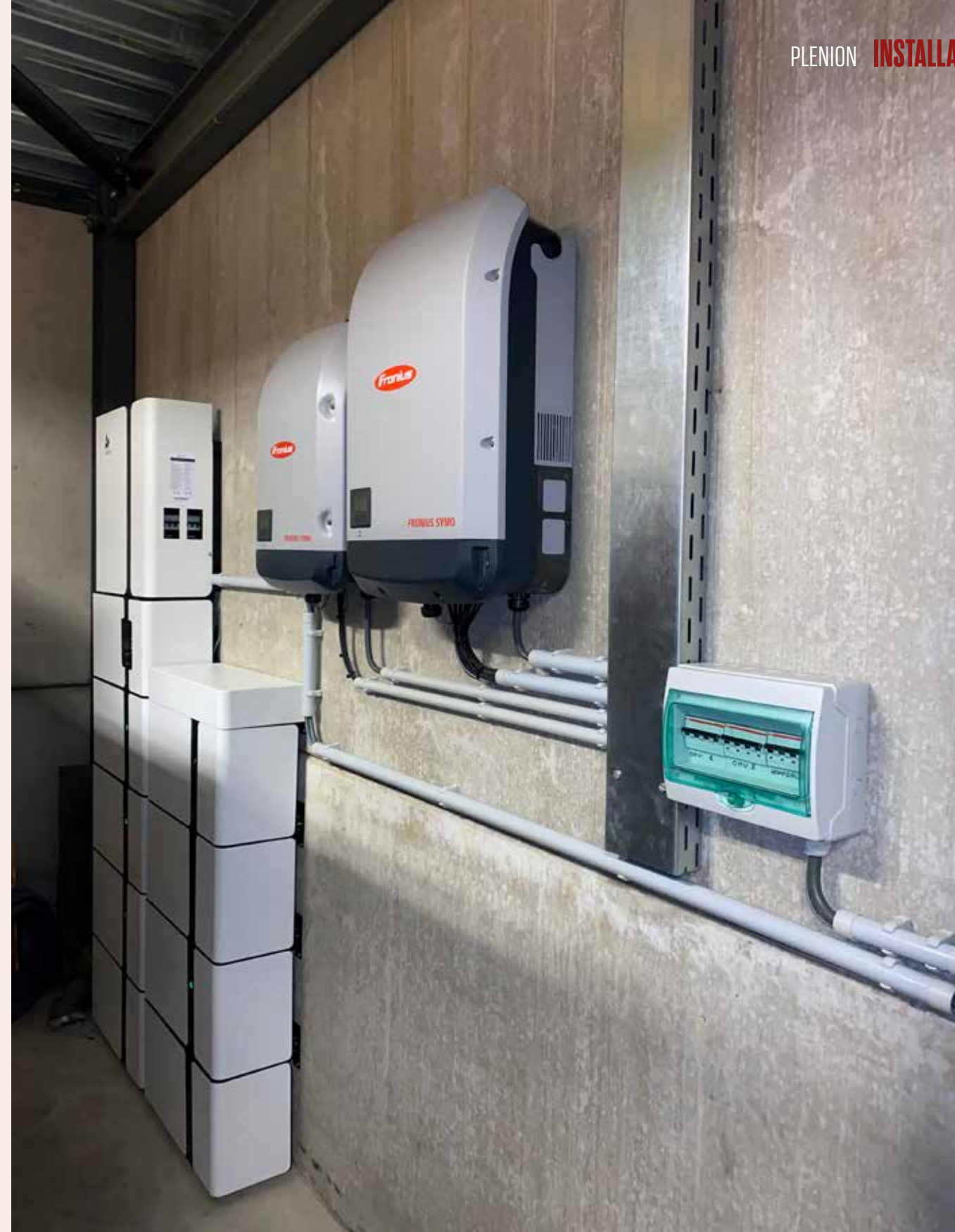
Plenion positioneert zich als ERP voor de installatiesector.

Ook het bestaande facturatiepakket was aan vervanging toe, omdat het niet meer ondersteund werd. Voeg daar nog een nieuwe groeicyclus bij en je weet dat je ondersteuning – en meer specifiek digitalisering – nodig zal hebben. Na een marktonderzoek kwamen ze bij ons uit. Het eerste voordeel was uiteraard dat we ons positioneren als ERP voor de installatiesector. In dit geval was waarschijnlijk wel het belangrijkste van dit pakket dat het door zijn modulaire karakter kan meegroeien met een bedrijf. Het meest dringend waren de facturen en daarna maakten ze ook de offertes in het nieuwe systeem. Waardoor die ook meteen wederzijds aan elkaar konden worden gekoppeld."